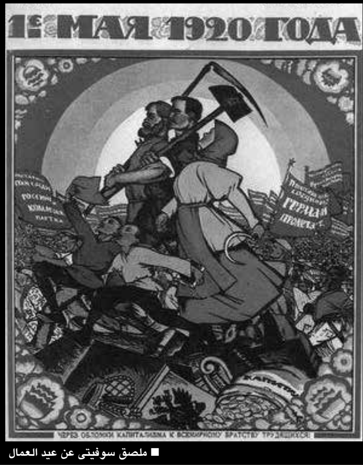
■ ملصق سوفيتي عن عيد العمال

عيد العمال يحتفل به في الولايات المتحدة أول يوم إثنين في سبتمبر. وفي كثير من الأحيان يتخذ الناس هذا اليوم كيوم للاحتجاج السياسي