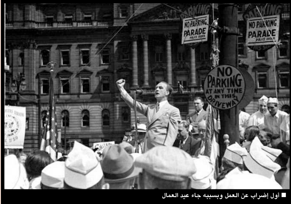
■ أول إضراب عن العمل وبسببه جاء عيد العمال

يحتفل به في يوم 1 مايو وهو يوم عطلة عامة. في كثير من البلدان يسمى بعيد العمال العالمي أو عيد العمال، حيث يتم تنظيم احتفالات من قبل النقابات العمالية والاتحادات والجماعات الاجتماعية. وهو يوم عطلة في الكثير من الثقافات.