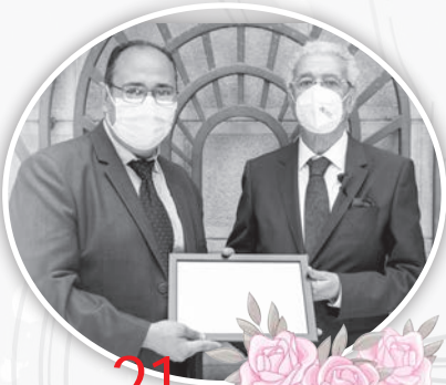
21 عاماً في بافاريا أمير أنيس