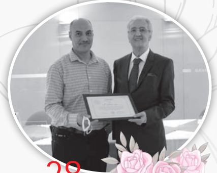
28 عاماً في بافاريا سيد سرحان