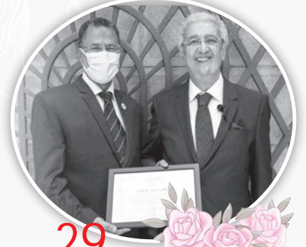
29 عاماً في بافاريا منصور سيد