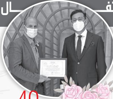
40 عاماً في بافاريا فضل قاصد