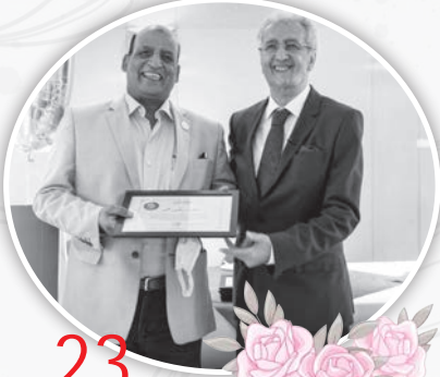
23 عاماً في بافاريا على مرتضى