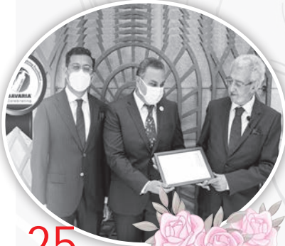
25 عاماً في بافاريا كيرلس القمص