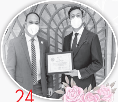
24 عاماً في بافاريا لبيب سمير