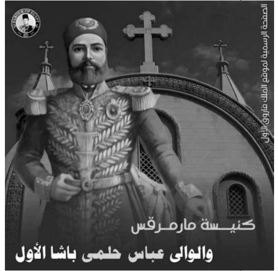
الصفحة الرسمية لموقع الملك فاروق الأول