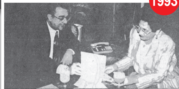
جانب من لقاء الدكتورة فتيص كامل وزيرة البحث العلمي والدكتور المهندس نادر رياض رئيس مجلس إدارة شركة بافاريا مصر

تجارب مصرية مشرفة حول الأيزو ٩٠٠٠ شركة صناعية تفتح المجال نحو آفاق عالمية جودة الشاملة دعم لقضية التطور المستمر وتوفير للحماية الكاملة لحقوق العميل