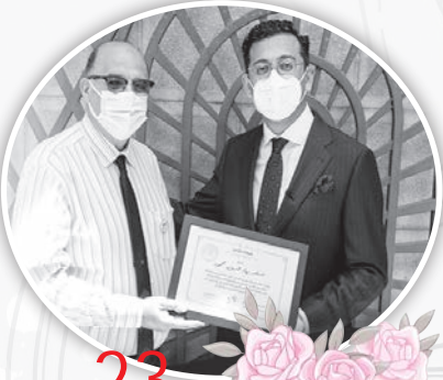
23 عاماً في بافاريا أسامة بهاء الدين