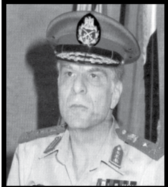
رئيس أركان حرب القوات المسلحة المصرية