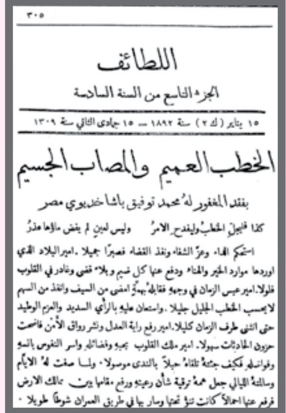
خبر وفاة الخديوى محمد توفيق فى يناير ١٨٩٢