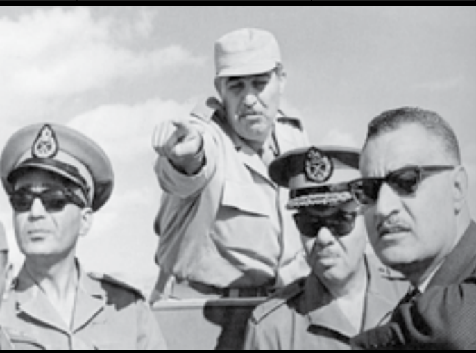
عبدالناصر في إحدى المناورات الحربية ومعه الفريق محمد فوزي و سداत्मع رياض