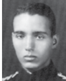
الطالب أثناء دراسته بالكلية الحربية