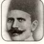
أحمد لطفى السيد