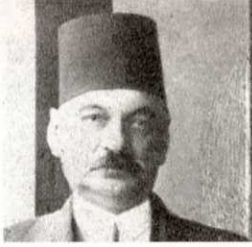
عدلى يكن باشا

حملت لواء الثورة عقب نفى زوجها الزعيم سعد زغلول إلى جزيرة سيسيل، وساهمت بشكل مباشر وفعال في تحرير المرأة المصرية