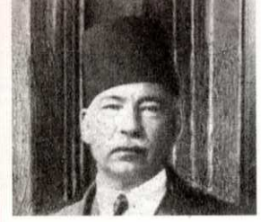
عبد الخالق ثروت باشا

إن كانت السلطة الإنجليزية الغاشمة قد اعتقلت سعدا ولسان سعد، فإن قرينته شريكة حياته السيدة صفية زغلول تشهد الله والوطن على أن تضع نفسها في نفس المكان الذي وضع زوجها العظيم