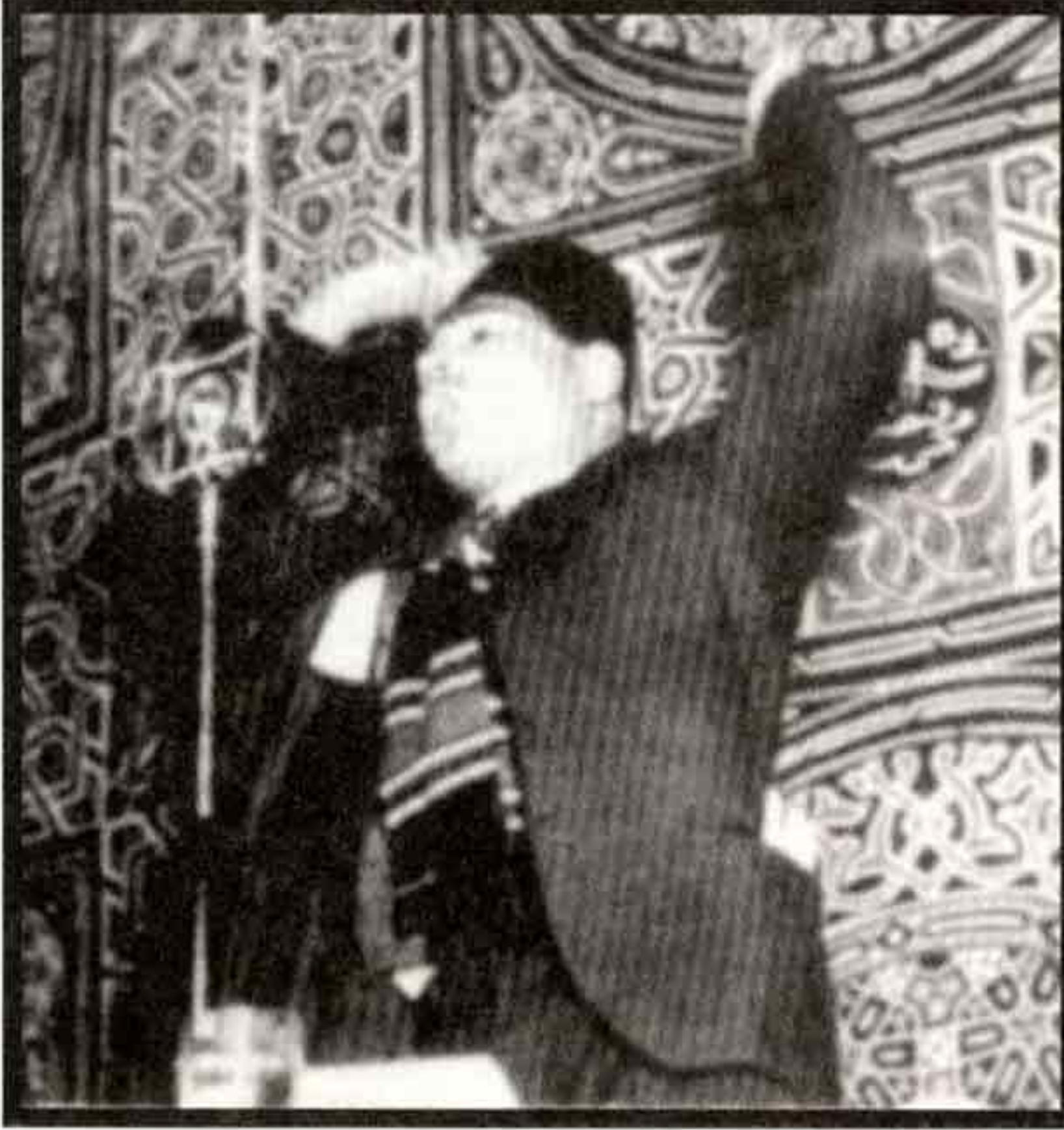
أحد المرشحين في الانتخابات يلقي خطابا حماسيا ويعد الناخبين بمنزل وسيارة لكل مواطن في انتخابات ١٩٣٠ .