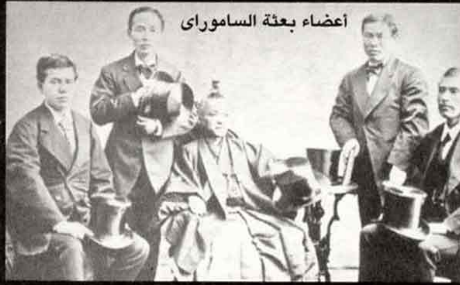
أعضاء بعثة الساموراي

العسكرية، وقضى معها على عزلة اليابان التي استمرت قرابة ٢٦٠ عاماً، شهدت تلك الفترة اهتماماً كبيراً من جانب زعماء الإصلاح بدولة محمد علي الحديثة في مصر. فقد نظرت حكومة ميحي إلى مصر آنذاك عل يانها نموذج يحتذى به ومثال وخبرة لا بد لليابان أن تدرسه وتستفيد منه. فقد أوفد زعماء الإصلاح في اليابان العديد من العيئات الخارجية لأوروبا وأمريكا لدراسة سبل تكوين دولة حديثة في اليابان تحت شعار دولة قسوية وشعب غني، فالقوة هي التي سوف تحمي استقلال اليابان كما يعتقد فوكوزاوا.