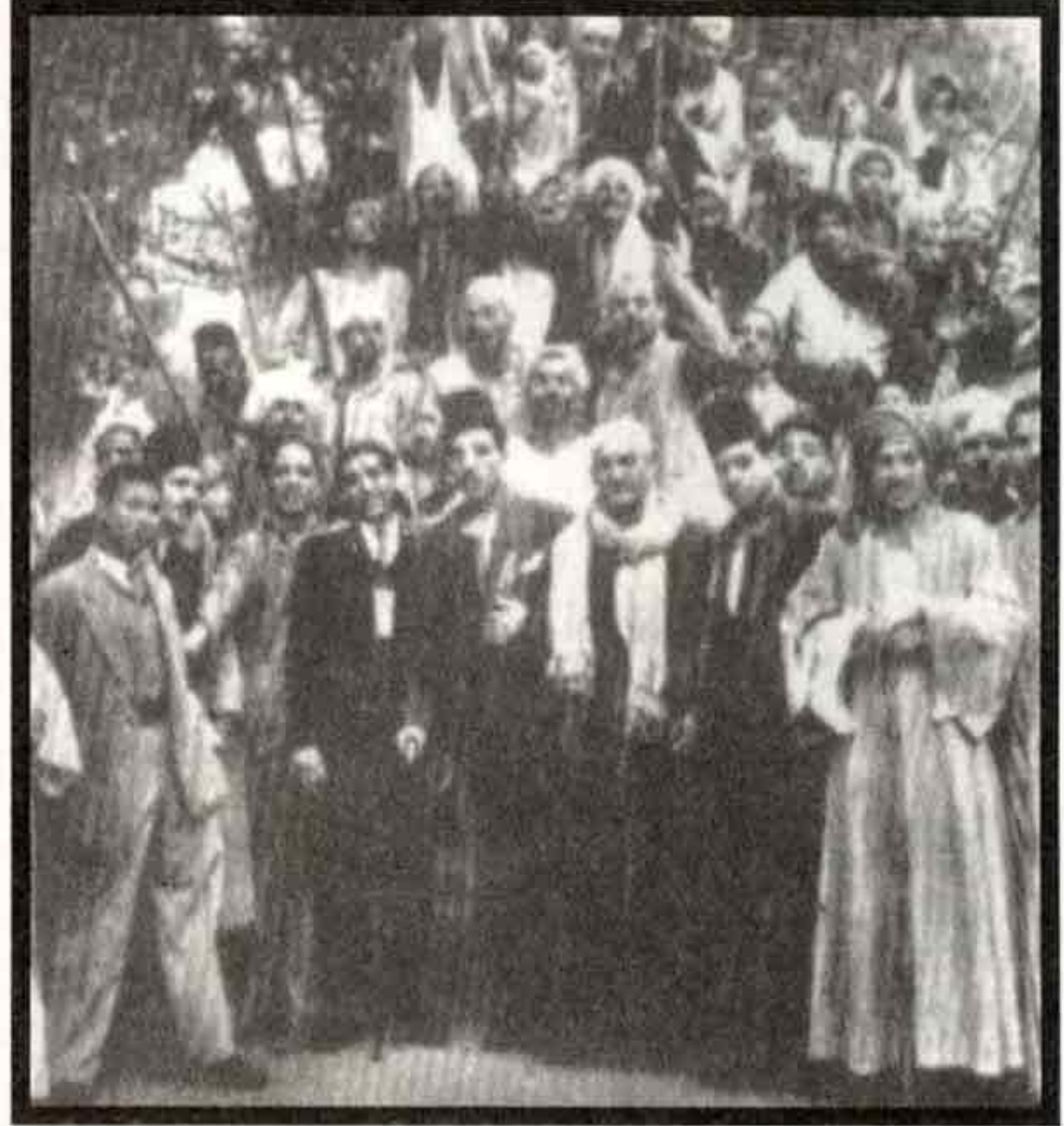
العصى والشوم اللغة الوحيدة في انتخابات ١٩٣٠