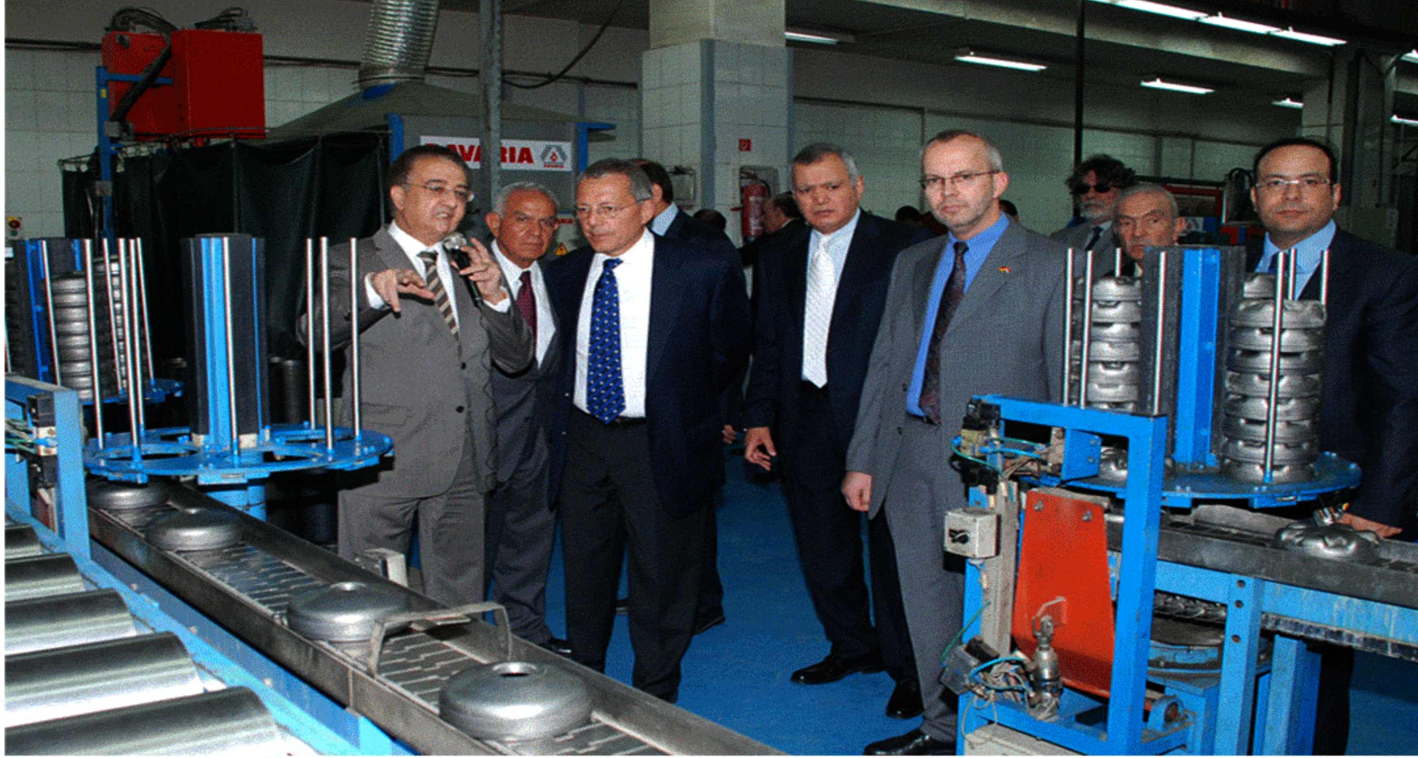
السفير الألماني أثناء زيارته لمصنع «بافاريا»

الجودة العالمية تمثل الخط الطموح من الشركات الرائدة التي لها الريادة في مجالها وهو ما يتمشى مع المستقر في الأعراف الاقتصادية الدولية، وشركة بافاريا سباقة في نقل التكنولوجيا المتقدمة رغم أعبائها التمويلية وهو ما يثبت أن الجودة عليها أن تتفوق على نفسها حتى في غيبة منافسة خارجية لتثبت أقدامها عالمياً.