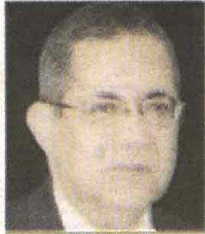
نموذج للشخصية المصرية الصميعة

السفير جمال بيومى مساعد وزير الخارجية للشئون الأوروبية السابق وأمين عام اتحاد المستثمرين العرب.. يقول إن د. نادر رياض هو المسيحي الفاضل.. وذو الثقافة الشرقية الإسلامية.. شارب من ماء النيل.. ابن بلد.. الرجل الدبلوماسي.. ذو القدرة على الانفتاح العالمي رغم أنه من الشخصيات المصرية الصميعة.. إلا أن لديه القدرة على الانفتاح على العالم الخارجي.. والخروج بوجه جميل ومشرف لمصر. تتشابه معاً أننا من دمياط ورغم أن د. نادر رياض من دمياط إلا أنه في الحقيقة أشهد له بكرمه الزائد حيث يقوم بمجاملتي في العديد من المناسبات الدينية. وهو شعور جميل من شخص طيب.. ودمت الأخلاق ويعد نادر رياض من الذين وقفوا وساندوا الحكومة في سياسات الإصلاح الاقتصادي.. ومن أكبر المساندين أيضا خلال التفاوض مع بنود اتفاقية الشراكة الأوروبية حيث كان من رجال الصناعة الواقفين وراء الجهة الحكومية المتفاوضة ومن المؤمنين بأهمية تلك الاتفاقية في تدعيم التعاون المصري الأوروبي وإن لم يتحقق ذلك ستنتي المنافسة الأوروبية داخل دولتنا سواء شئنا أم أبينا.