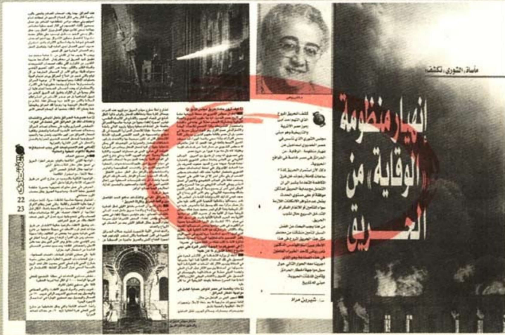
أسباب التورق، تكشف