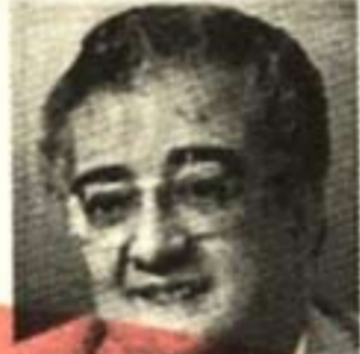
بقلم: نادر رياض

تناول الحوار الحريق المروع الذي التهم أحد أبرز رموز مصر الأثرية والتاريخية وهو مبنى