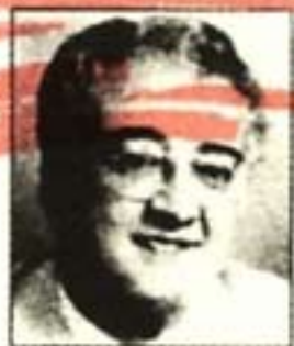
بقلم : د. نادر رياض