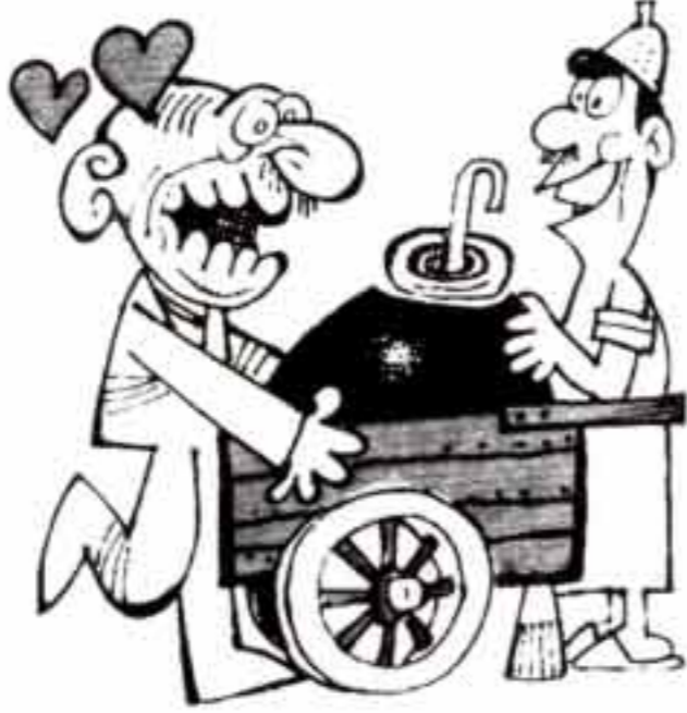
الحباب الخيال بتصميم ١٩٦٥ بطولة هند رستم وعماد حمدي واخراج زهير بكير