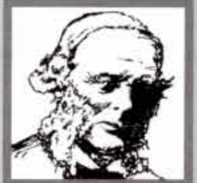
جيمس وات مخترع التنظيم في العمليات الجراحية إنجليزي ١٨٢٧، ١٩١٢ م