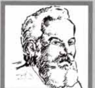
جراهام بيل مخترع التليفون اسكتلندي ١٨٤٧، ١٩٢٢ م

انتقلت سيدة عجوز إلى مسكن قريب من أحد الموانئ وذات يوم أطلقت بارجة حربية مدافعها عدة مرات تحية لأحد كبار الرسميين فنهضت العجوز وأصلحت من هيئتها أمام المرأة واتجهت نحو الباب وقالت: من الطارق!!