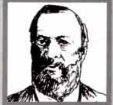
نيكولاس أوتو مخترع آلة الاحتراق الداخلي ألماني ١٨٣٢، ١٨٩١ م