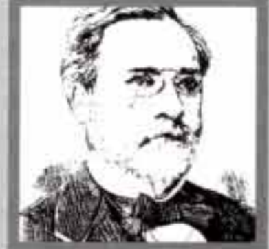
لويس باسطينير مخترع البسترة فرنسي ١٨٨٢، ١٨٩٥ م