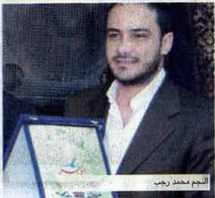
النجم محمد رجب