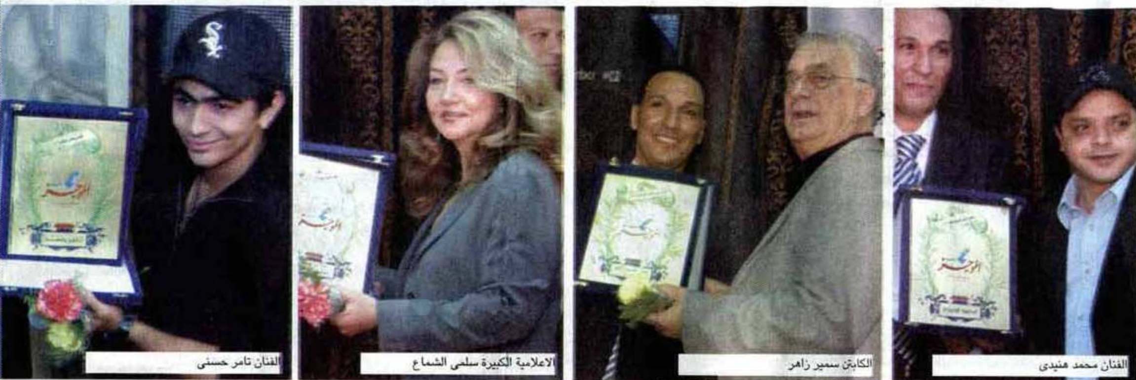
الفنان تامر حسنى

حضر الحفل مجموعة كبيرة من الوزراء والفنانين ورجال الأعمال الذين أشادوا بمستوى الجريدة