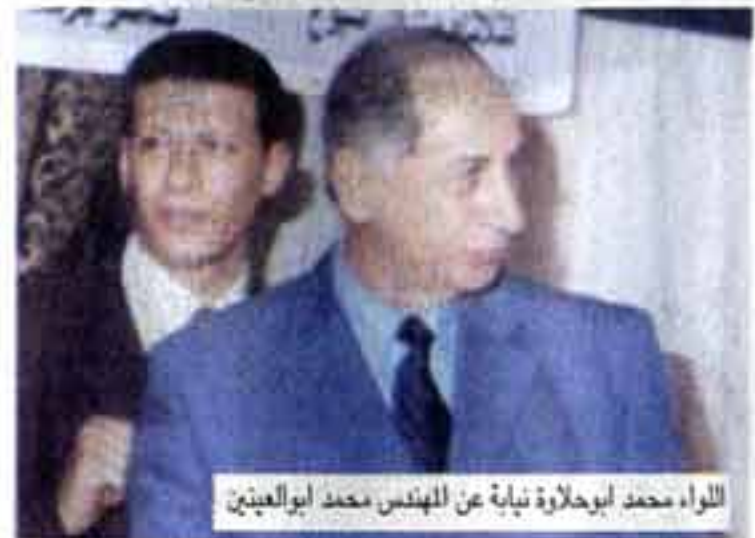
اللواء محمد أبو حلاوة نيابة عن المهندس محمد أبو العينين