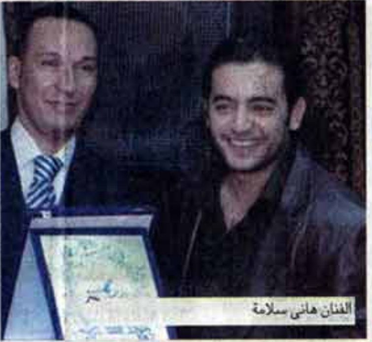
الفنان هاني سلامة