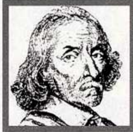
وليم هارفي مكتشف الدورة الدموية إنجليزي ١٥٧٨-١٦٥٧م