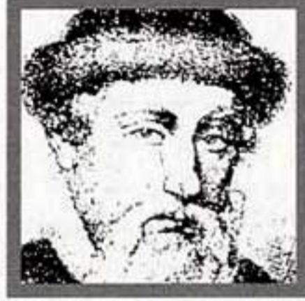
يوحنا جوتنبرج مخترع الطباعة الماني ١٤٠٠-١٤٦٨م