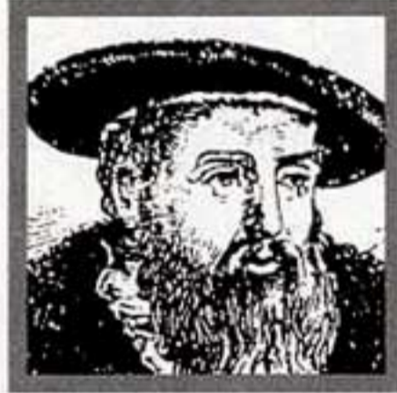
يوهانس كبلر مكتشف قوانين حركة الكواكب الماني ١٥٧١-١٦٣٠م