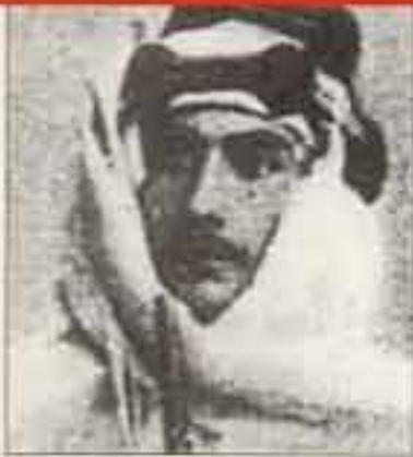
الأمير يوسف كمال

وفى عام ١٩٥٤ ترك العمل بكلية الفنون الجميلة ليتولى منصب مدير متحف الفن الحديث بالقاهرة، فحواله إلى خلية من النشاط الفكرى والثقافى.. ثم ارتقى إلى منصب مدير المتاحف الفنية عام ١٩٥٨.. ولم يستمر فى