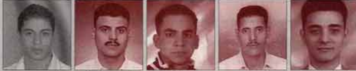
اميل شنودة محمود عيد محمد احمد احمد رمضان عمرو محمد