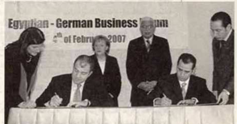
د. أحمد نظيف رئيس مجلس الوزراء وميركل المستشارة الألمانية يشهدان توقيع الاتفاقيات الأربعة