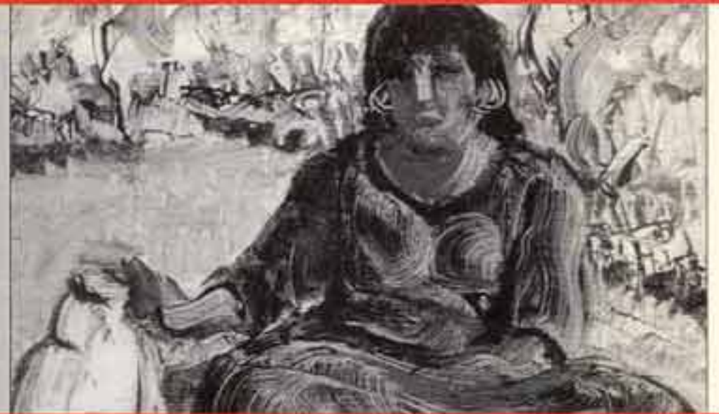
من أعمال الفنان الكبير صلاح طاهر فى مراحل مختلفة من حياته