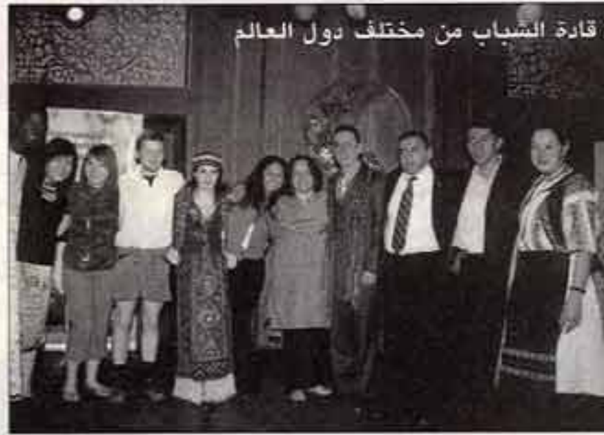
قيادة الشباب من مختلف دول العالم