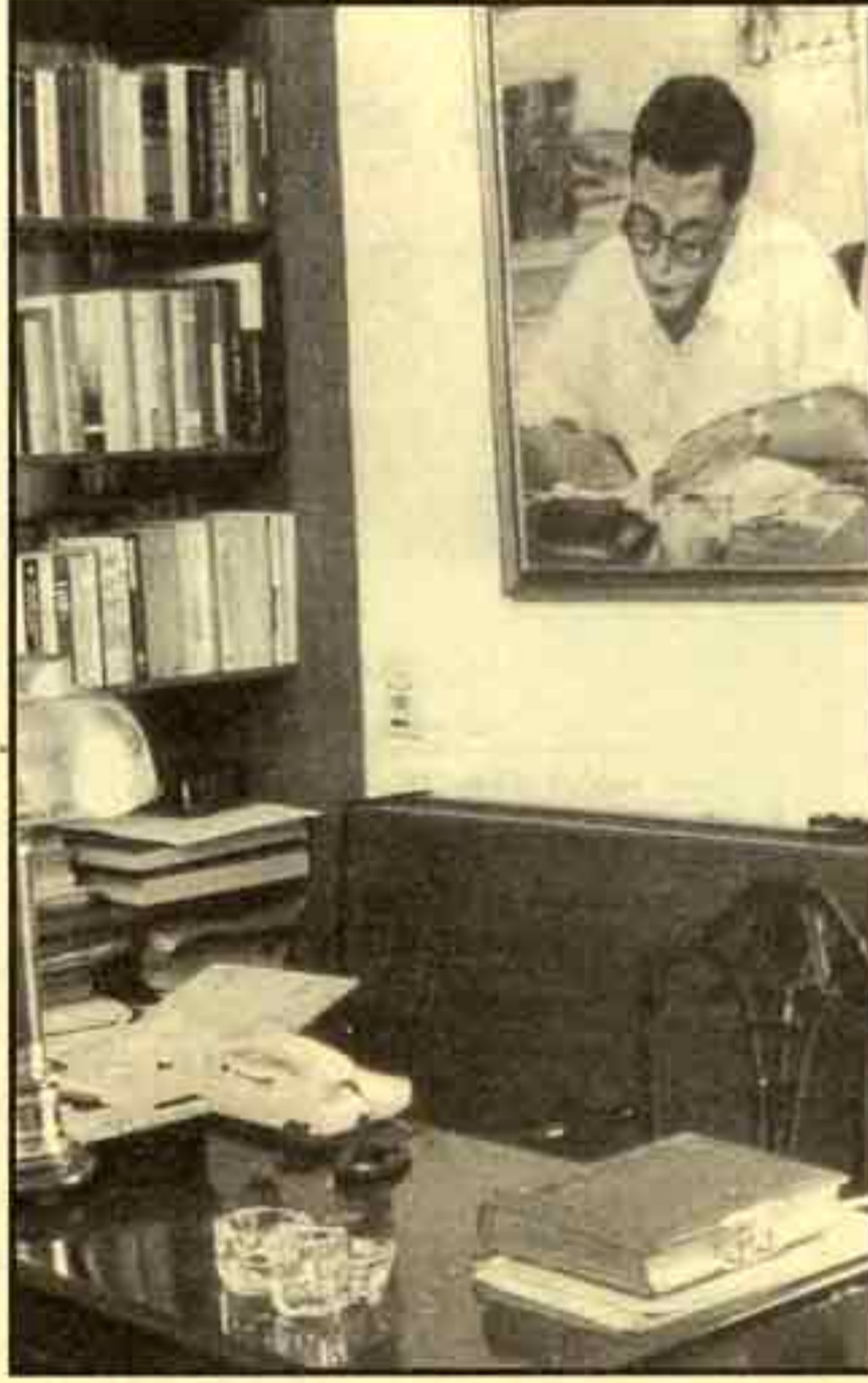
مكتب الاستاذ أحمد بهاء الدين بمنزله

في عام ١٩٨٩ أصيب الكاتب الكبير أحمد بهاء الدين بنزيف في المخ وأصيب بغيبوبة كاملة وظل غائباً عن الوعي ست سنوات كاملة إلى أن توفي في ٢٦ أغسطس ١٩٩٦.