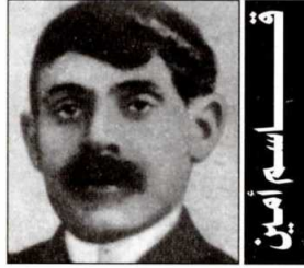
ولد قاسم أمين

ولدت في ٨ أغسطس ١٩٢٣ بمدينة دمياط وحصلت على دكتوراه في الأدب من جامعة القاهرة ١٩٥٧. تدرجت بسلك الوظائف حتى أصبحت استاذة ورئيس القسم، شغلت منصب مدير ثقافة الطفل ورئيس قسم النقد بمعهد الفنون المسرحية ثم مديرة أكاديمية الفنون، وانتخبت وهي طالبة في الجامعة سكرتيرة عاما للجنة الوطنية للطلبة والعمال ١٩٤٦ وهي اللجنة التي قادت الكفاح ضد الاحتلال البريطاني ثم رئيسة للجنة الدفاع عن الثقافة القومية ١٩٧٧ لها مؤلفات منها رواية «الباب المفتوح» وأشرفت على إصدار وتحرير الملحق الأدبي لمجلة الطليعة، من مؤلفاتها أيضا «مقالات في النقد الأدبي» مكتبة الأنجلو ١٩٦٤ «نجيب محفوظ الصورة والتمثال»، شاركت في مؤتمرات دولية عديدة، كما مثلت مصر في المؤتمرات العلمية الخاصة بالنقد الأدبي والأدب الإنجليزي ومؤتمرات الهيئات التابعة للأمم المتحدة في موضوع تنمية المرأة، حصلت على وسام الاستحقاق من الدرجة الأولى.