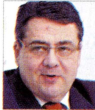
■ زيجمار جابريل

ومتكاملة والتي تتمثل فيما يزيد على ٥٤ منطقة صناعية موزعة على كل المحافظات ويبلغ عدد الشركات الألمانية العاملة بالسوق المحلية نحو ٢٩٠ شركة بحجم استثمارات كلى يصل إلى ٦ مليارات دولار ويعتبر مشروع شركة سيمنز الألمانية لإنتاج الكهرباء الذى شهد توقيعه الرئيس السيسى بتكلفة استثمارية بلغت قيمتها ٧٠ مليار جنيه ما يعادل ٨,١ مليار يورو. وأضاف أن هناك مجالات وآفاقا عديدة واعدة لتوسيع التعاون الاقتصادي والتجارى لاسيما فى قطاعات البناء والتعمير والبنية التحتية ومشروع تنمية محور قناة السويس موضحا ان الفترة الماضية شهدت عقد صفقات ألمانية ضخمة ومنها تعاقدات شركة سيمنز فى مجال الطاقة بقيمة ٨,٥ مليار يورو» وشركة هيرينكيشت فى مجال حضر الأنفاق بقيمة مليار يورو وشركة لينده ضمن كونسورتيوم ألماني مصري كورى يعتزم بناء أكبر مجمع للبتروكيماويات فى المنطقة بالعين السخنة بقيمة استثمارات تبلغ ٦ مليارات يورو ويبلغ نصيب الشركة الألمانية منها نحو ٢ مليار يورو.