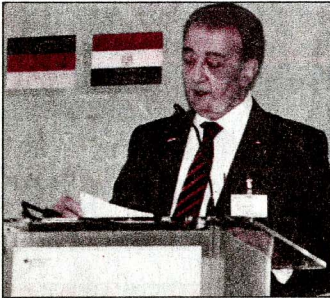
د. م. نادر رياض

أكد الدكتور مهندس نادر رياض رئيس مجلس الأعمال المصري الألماني في كلمته بالجلسة الافتتاحية بالمنتدى الاقتصادي الذي عقد على هامش زيارة الرئيس السيسي ولقائه بالمستشارة أنجيلا ميركل في برلين أن مصر هي بلد الفرص الواعدة، وأن الاستثمار في مصر في ضوء المشروعات الألمانية العاملة في مصر هي الأكثر ربحية والأكثر نمواً بالمقارنة بالاستثمارات الألمانية في أوروبا نظراً لحجم الطلب المبني على التركيبة السكانية لمصر، الذي قوامه ٩٠ مليون مستهلك، يقع ما يزيد على ٦٠٪ منه في شريحة ما دون سن الأربعين. كما إن هذا الاحتياج السلمي يمثل جميع المجموعات السكانية، هذا بالإضافة إلى أن البنية الصناعية التحتية في مصر قوية ومتكاملة، والتي تتمثل فيما يزيد على ٥٤ منطقة صناعية موزعة على جميع المحافظات.