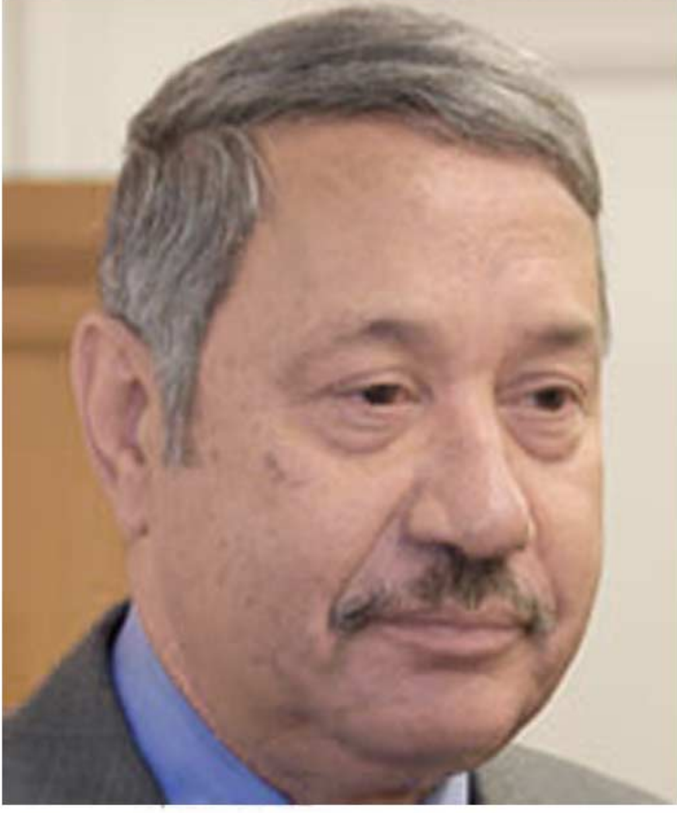
الفريق حمدي وهيبة