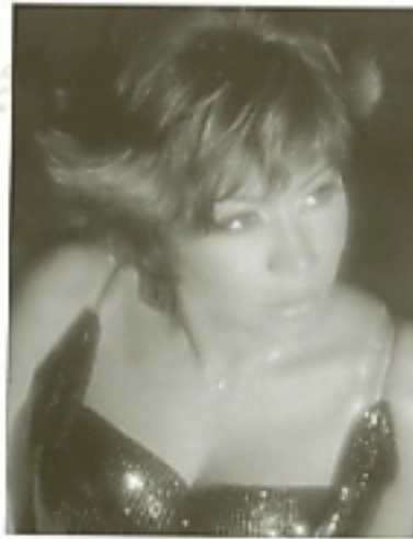
شييرين: تجمة الأغنية الشبابية... (كايرو تايمز، مارس ٢٠٠٢).

كل المطربون يتفننون بالحب، ولكن ليس كهذين التجمين، انهما جريشان و متفتحان، ويذوب المستمع وجداً في غنائهما.